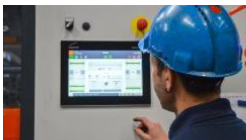
Bild 3: Die neue Steuerung unterstützt Bediener im Arbeitsalltag, vereinfacht Prozesse und schafft mehr Übersicht an der Maschine.

Bild 2: Effizient, leistungsstark, nutzerfreundlich: Die neue hartmetallfähige KASTOssb baut mit 2,9 Metern Ausbauraum extrem kompakt.