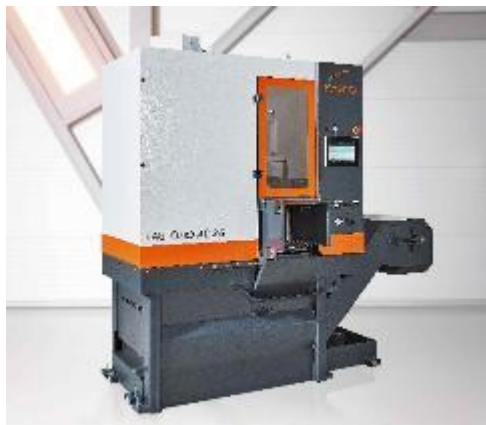
Bild 2: Effizient, leistungsstark, nutzerfreundlich: Die neue hartmetallfähige KASTOssb baut mit 2,9 Metern Ausbauraum extrem kompakt.