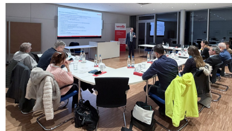
Ein spannender Abend mit hohem Praxisbezug und nachhaltigem Mehrwert

Die Rechte und Pflichten von Gesellschaftern im sensiblen Dreiecksverhältnis zwischen Familie, Unternehmensführung und Beirat waren zentraler Gegenstand der Veranstaltung „Als Gesellschafter nichts zu melden?“