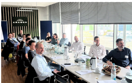
Die Fach-Erfa Controlling traf sich bei der KRAMER GmbH in Umkirch