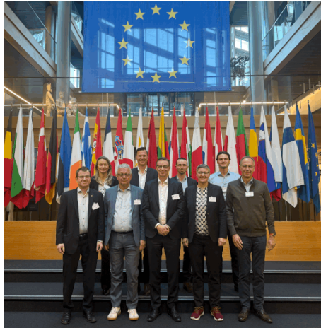
Die wvib-Delegation im Herzen Europas