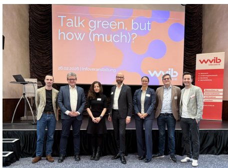
Die Zeiten für die, die Nachhaltigkeitskommunikation gestalten, sind herausfordernd

➤ Gregor Preis, preis@wvib.de , Jonas Vetter, vetter@wvib.de