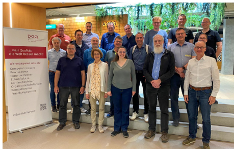
Praxis statt Theorie bei Hansgrohe

Beim Treffen der Fach-Erfa DGQ Regionalkreis Südbaden bei Hansgrohe bekamen die QM-Experten direkte Einblicke in einen gelebten FMEA-Prozess.