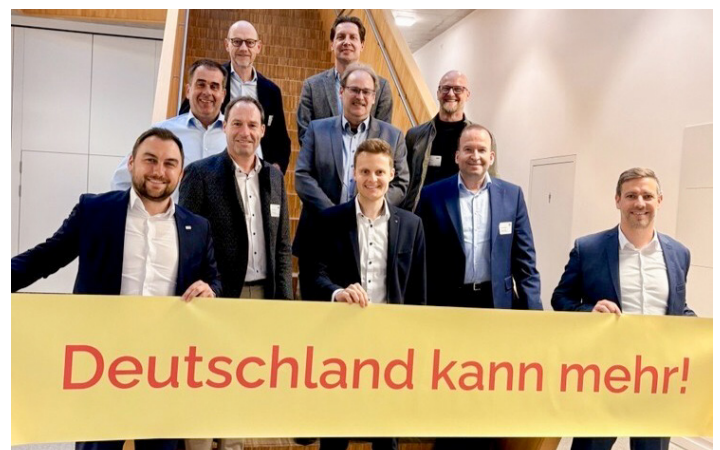
Deutschland kann mehr! Wenn es wieder lernt, konsequent auf seine industriellen Stärken zu setzen

➤ Marcel Spiegelhalter, spiegelhalter@wvib.de