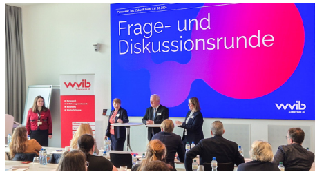
Der Personaler Tag bei Endress+Hauser Flowtec