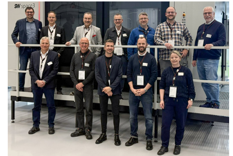
Blick in Unternehmensgeschichte und Datenperspektive

Die Schwäbische Werkzeugmaschinen GmbH (SW) ist ein global agierendes Unternehmen, das an Standorten in Deutschland, China, Mexiko und den USA über 6.000 Bearbeitungszentren pro Jahr fertigt.