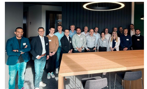
Weiter so oder radikal neu denken war die Frage bei den Vertriebsleitern

Die Frage beim Fach-Erfa-Treffen der Vertriebsleiter bei der KNF Vertriebs GmbH lautete nicht „Was läuft gut?“, sondern: „Haben wir den Vertrieb richtig aufgebaut oder müssen wir ihn grundlegend neu denken?“