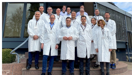
Erfahrungsaustausch als Mehrwert

Gastgeber für das Treffen der Fach-Erfa Lieferanten Qualitätsmanager war die Kübler Group in Villingen-Schwenningen.