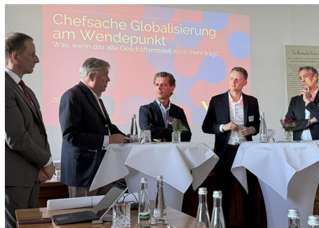
Offener Austausch mit Prädikat „Tacheles“

sagt klar: Entwicklung und Innovation ausschließlich aus Deutschland heraus funktionieren nicht mehr. So sind die Kosten für den Faktor Arbeit in Eisenbach im Hochschwarzwald mittlerweile höher als in Zürich.